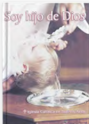
Catequesis para la Familia