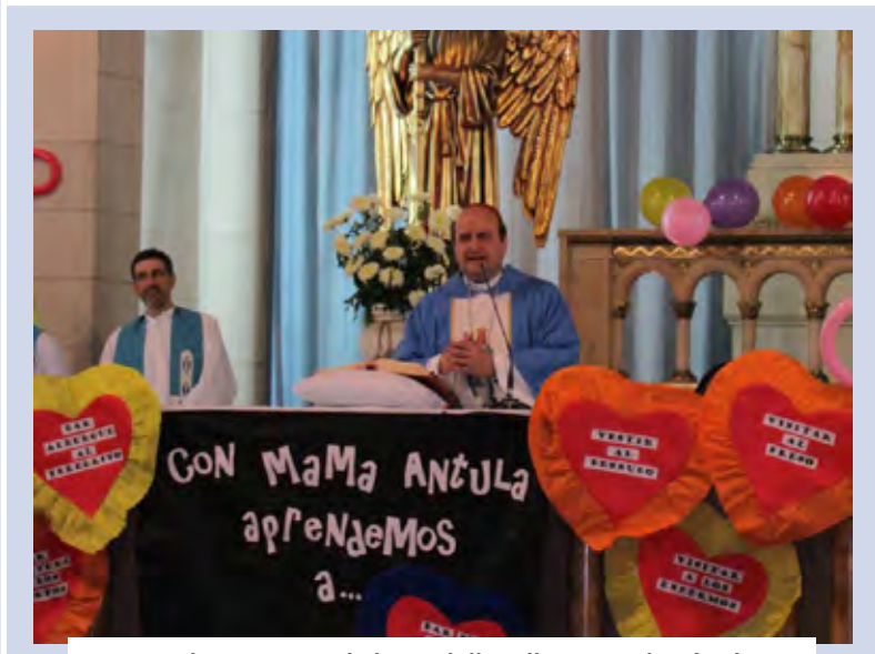
Parroquia Ntra. Sra. de la Medalla Milagrosa Vicaría Flores