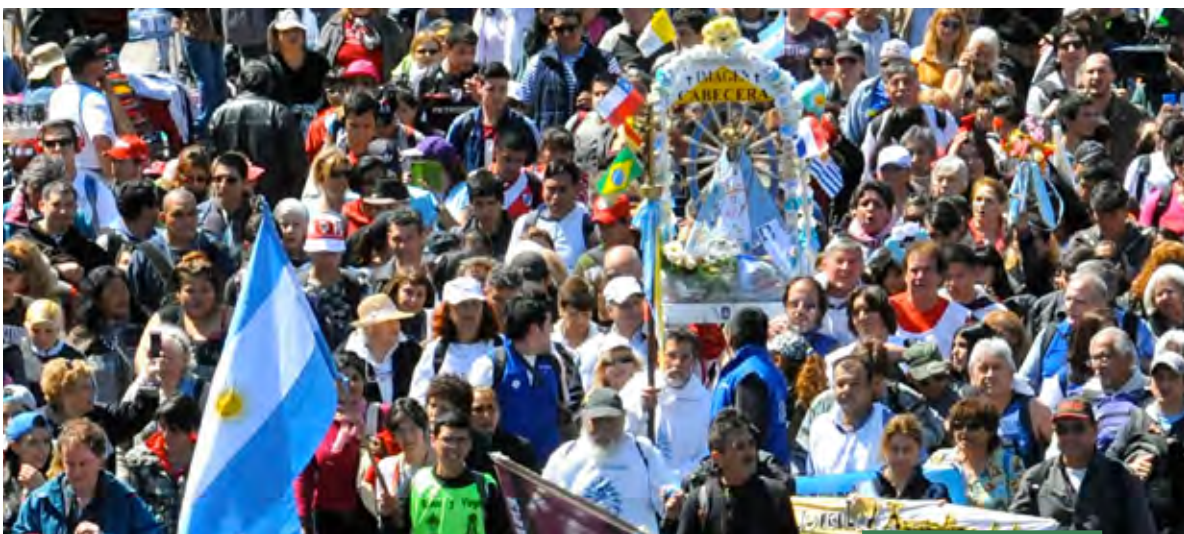
Imagen cabecera de la peregrinación que parte desde San Cayetano de Liniers