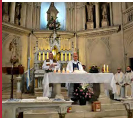
Culmen del encuentro: la Eucaristía