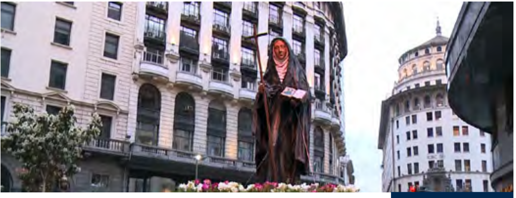
Imagen de Mama Antula por las calles de nuestra ciudad