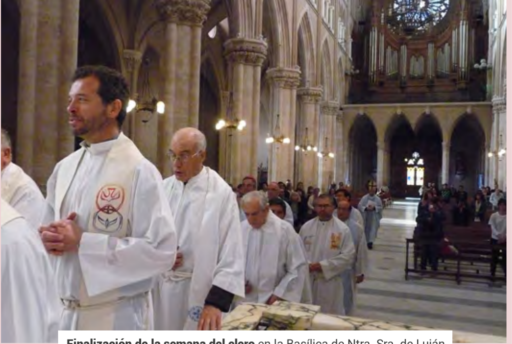
Finalización de la semana del clero en la Basílica de Ntra. Sra. de Luján