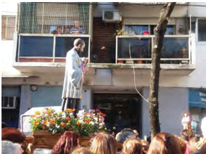
En procesión con el santo patrono por las calles del barrio de Belgrano

Cada 7 de agosto, día de san Cayetano, nuestra parroquia y santuario se agranda y sacamos la fiesta a la calle para recibir y abrazar a los miles de peregrinos que se acercan a confiarle sus pedidos y agradecimientos al santo patrono del Pan y del Trabajo.