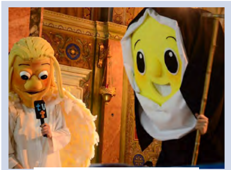
Parroquia Inmaculada Concepción Vicaría Devoto