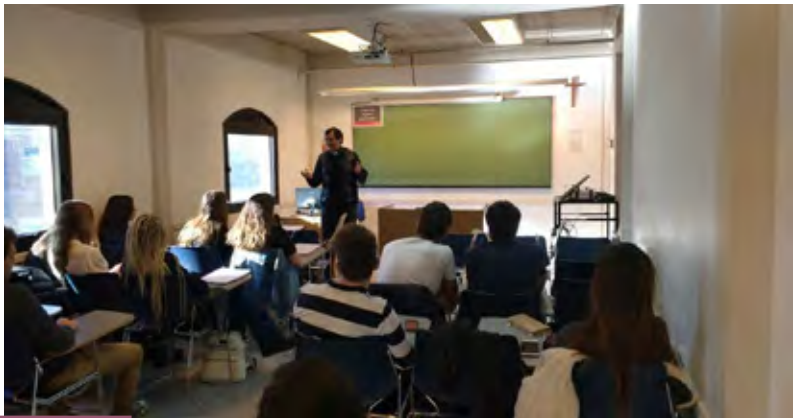
Durante la jornada se brindaron testimonios vocacionales en las aulas del seminario

La página de Facebook donde se puede visitar y ver todo el contenido que se fue publicando se llama "Semana del Seminario", y los usuarios en Instagram y Twitter son @SemanaSeminario.■