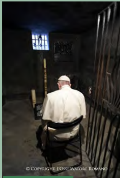
Francisco rezó en la celda de San Maximiliano Kolbe