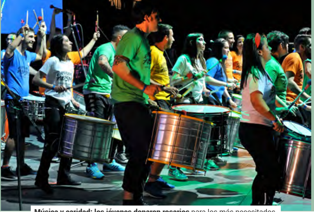
Música y caridad: los jóvenes donaron rosarios para los más necesitados