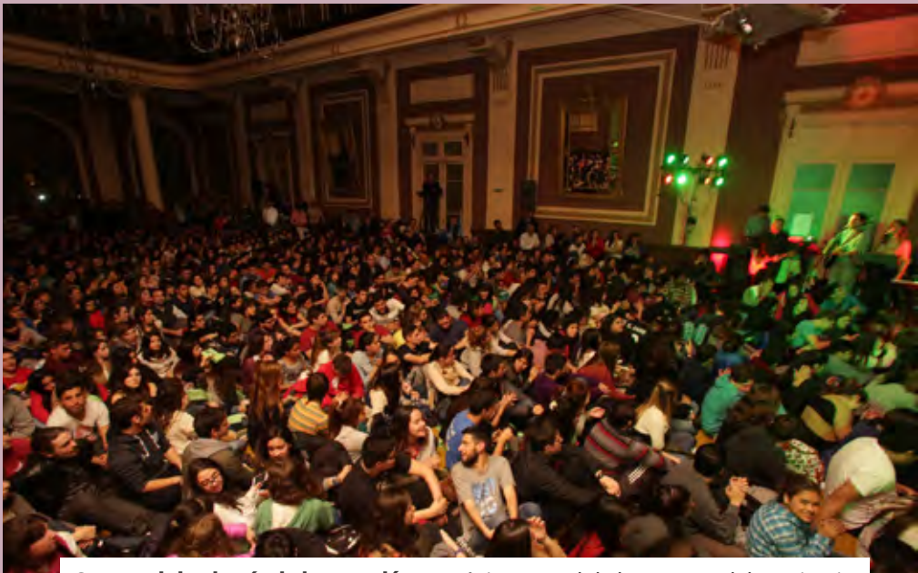
Compartir la alegría de la vocación propósito central de la semana del seminario