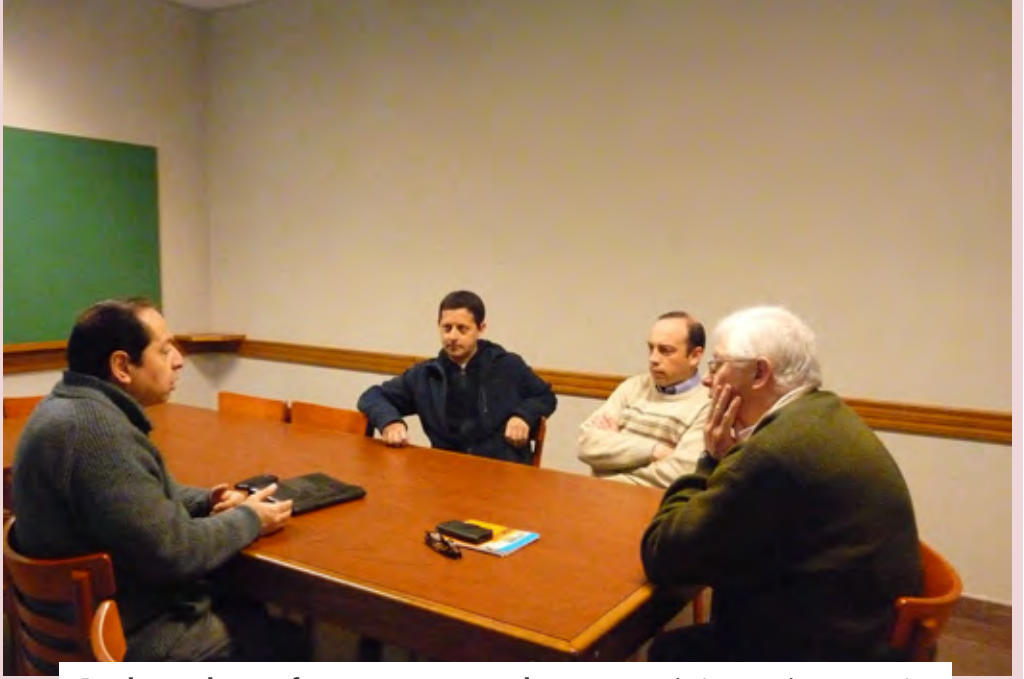
Dos instancias que fueron constantes en la semana: trabajo grupal y santa misa