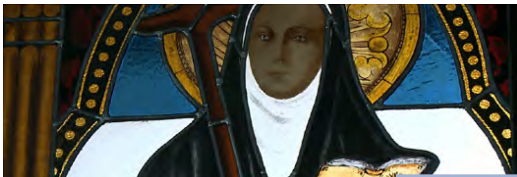
Vitreux de Mama Antula en la Basílica de Ntra. Sra. de la Piedad

Sabemos que los vecinos del puerto de la Santísima Trinidad de los Buenos Aires no la recibió como se merecía, y durante casi un año debió padecer la incomprensión y la negativa a sus deseos. Pero pudo más su perseverancia y mansedumbre, porque a poco de conocerla, las autoridades—el obispo y el virrey— y el pueblo todo, aprobaron y adhirieron a su apostolado primero, y se constituyeron en incondicionales benefactores de la construcción de la Santa Casa, después. Requerida estaba como lo señala en otra carta: «Encontrándome en esta ciudad, el obispo de nuestra tierra (Córdoba) me ha mandado a llamar, para que camine por las ciudades y pueblos con el fin de dar los ejercicios; pero teniendo tanto trabajo aquí, no he podido complacerlo, porque quedaría mucha gente sin concurrir a los ejercicios y no lograría el fin para el que el Señor me trajo» (Carta al P. Gaspar Juárez, Buenos Aires, 28 de noviembre de 1781).