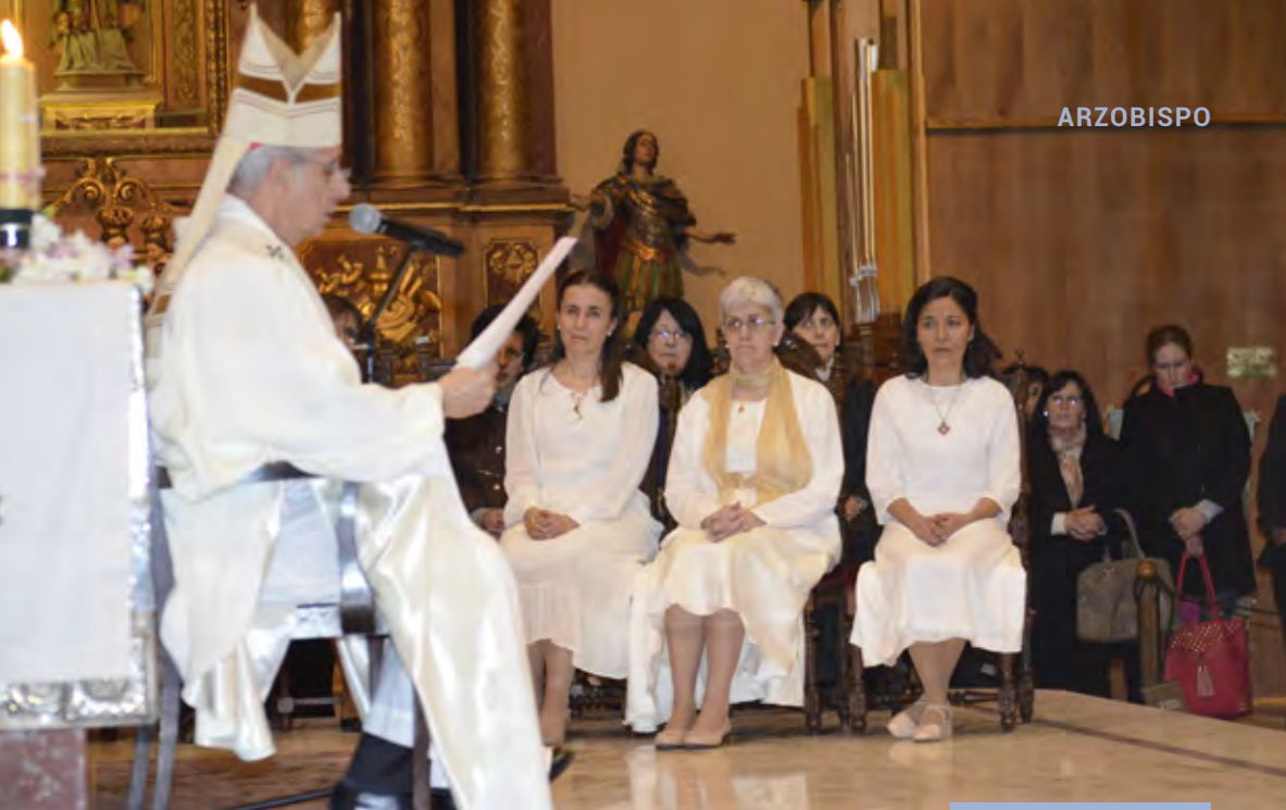
Momento de la celebración de la consagración de vírgenes

En la vida de la Iglesia, el Orden de la Vírgenes Consagradas surge en los tiempos en que San Ambrosio de Milán, en las últimas décadas del siglo IV, alentó a pequeños grupos de jóvenes que aspiraban a vivir una vida austera, con la observancia de la castidad, alimentadas por la Palabra de Dios, el ayuno, la práctica de las obras de misericordia y otras prácticas ascéticas. Vivían en el ámbito familiar y las identificaban por su espíritu de servicio a los pobres y enfermos, y todo lo realizaban con discreción y serena alegría.