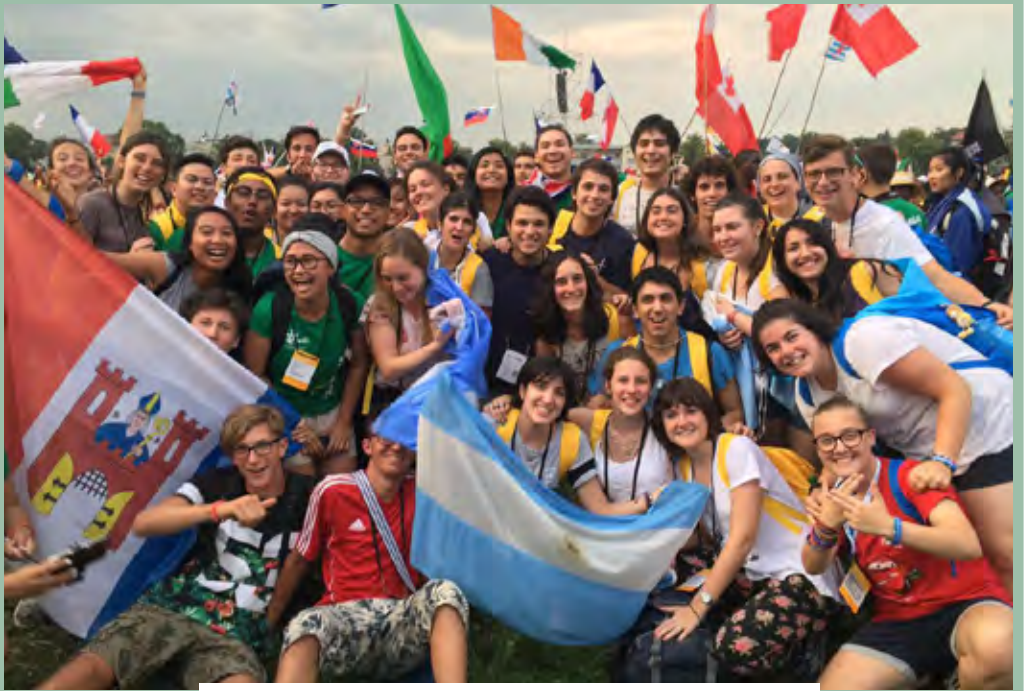
Parte de la delegación de la Pquia. San Nicolás de Bari