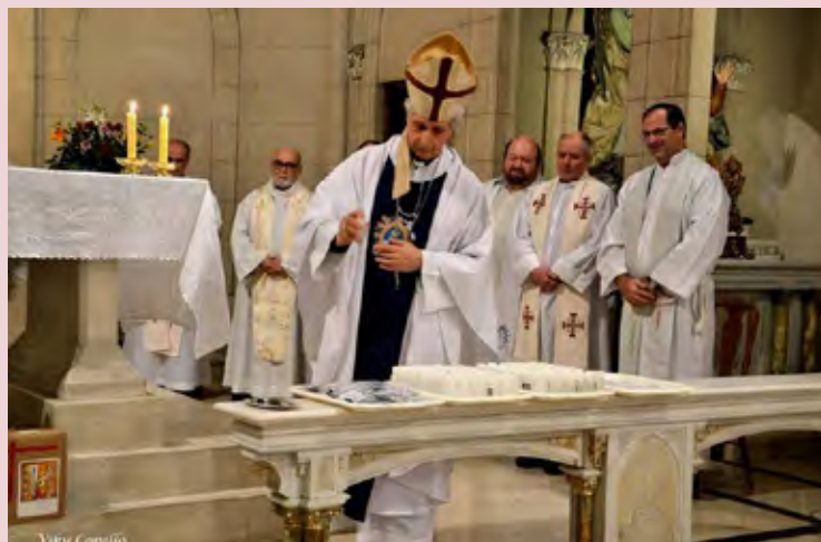
El Cardenal bendice objetos religiosos confeccionados por las Carmelitas Descalzas para las religiosas y los religiosos participantes