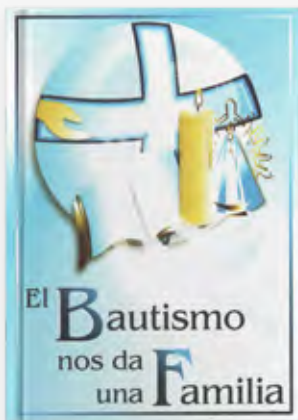
Catequesis de la celebración