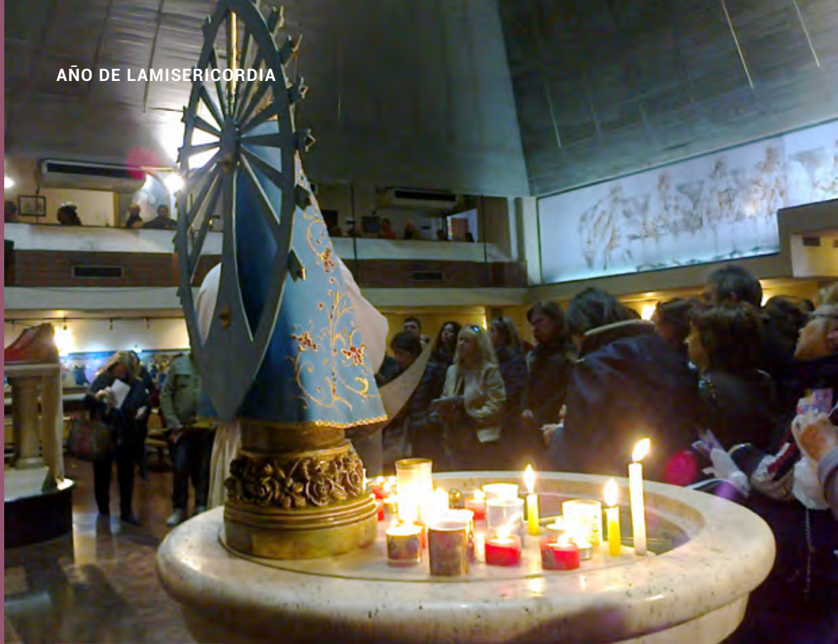
Dentro del templo y bajo la mirada de la Virgen de Luján, los fieles celebran a San Cayetano

los jóvenes en la calle para que todos los peregrinos que participamos de la procesión pudiéramos hacer la experiencia de dejarnos abrazar por la misericordia del Padre. Nos recibió una lluvia de papeletos de colores y los sonidos de una banda militar. A continuación celebramos la misa presidida por nuestro obispo, quien nos invitó a poner nuestra confianza en el verdadero Buen Samaritano: Jesús, que se conmueve y se acerca a curar nuestras heridas, haciéndonos capaces de poner en segundo plano nuestras necesidades para socorrer las de nuestro prójimo.