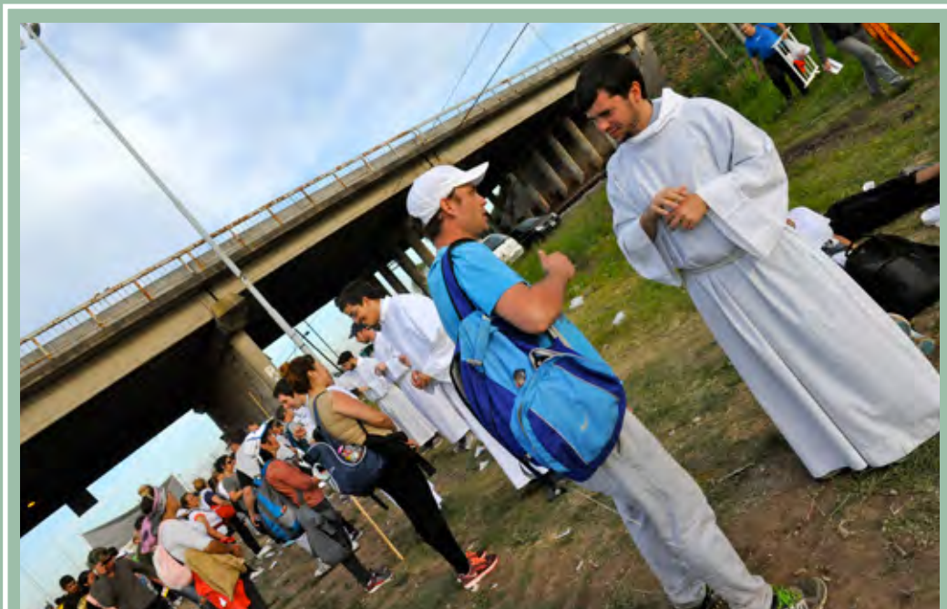
Los sacramentos del Bautismo y de la Reconciliación se celebraron en el puesto de la Ruta 6. También los seminaristas pidieron la bendición para los peregrinos