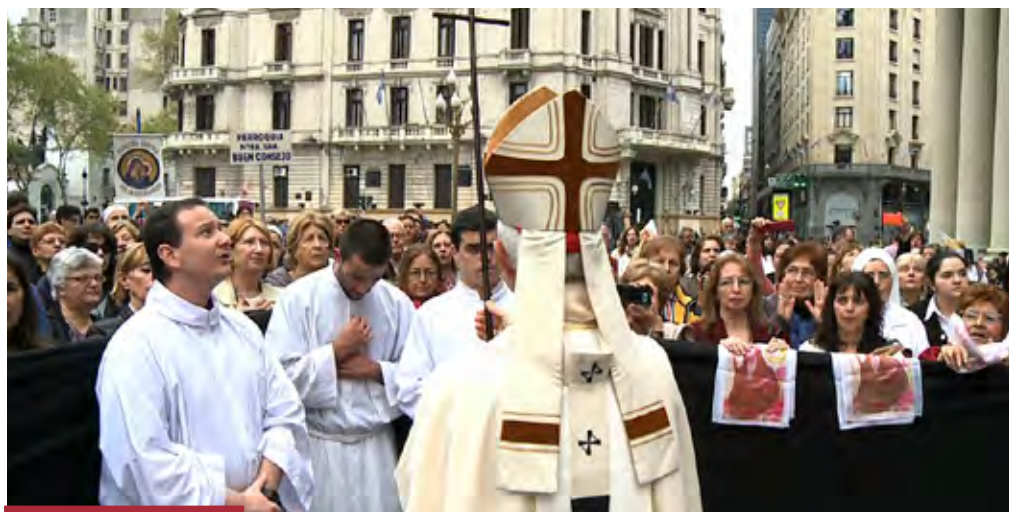
El Card. Mario A. Poli en el atrio de la catedral al inicio de la celebración