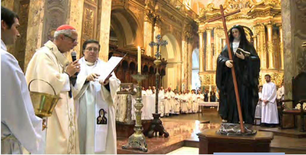
El Card. Mario Poli bendiciendo la imagen de la beata Mama Antula

que la guiaba por los soledosos caminos del Virreinato colonial, también le había tocado los labios diciéndole: «Yo pongo mis palabras en tu boca» (Jr 1,9). Y sus cartas, sus numerosas cartas dejaron impresas las palabras buenas y sabias, que brotaban de un corazón enamorado del Evangelio de Jesús, que deseaba fuese conocido hasta el último rincón del territorio... Si le preguntamos a la Beata de los Ejercicios cómo fueron los comienzos de su peregrinación, ella misma responde: «Miserable que soy. No lo sé. Sin embargo la cosa es así. Además, si ustedes quieren que les instruya sobre cómo cuidar, estoy toda enamorada de la Providencia sobre mí indigna que soy, sepan que en penosos viajes, en los terruños tan malos, en los desiertos, obligada a pasar ríos, arroyos, siempre he caminado a pies desnudos, sin que nunca me pase nada adverso» (Carta al P. Gaspar Juárez, Córdoba del Tucumán, 6 de enero de 1778).