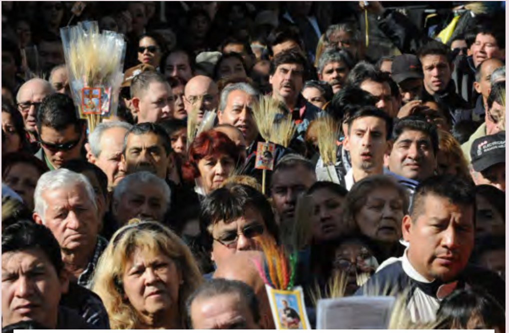
Una masiva expresión de fe se congrega en torno al santo patrono del pan y del trabajo