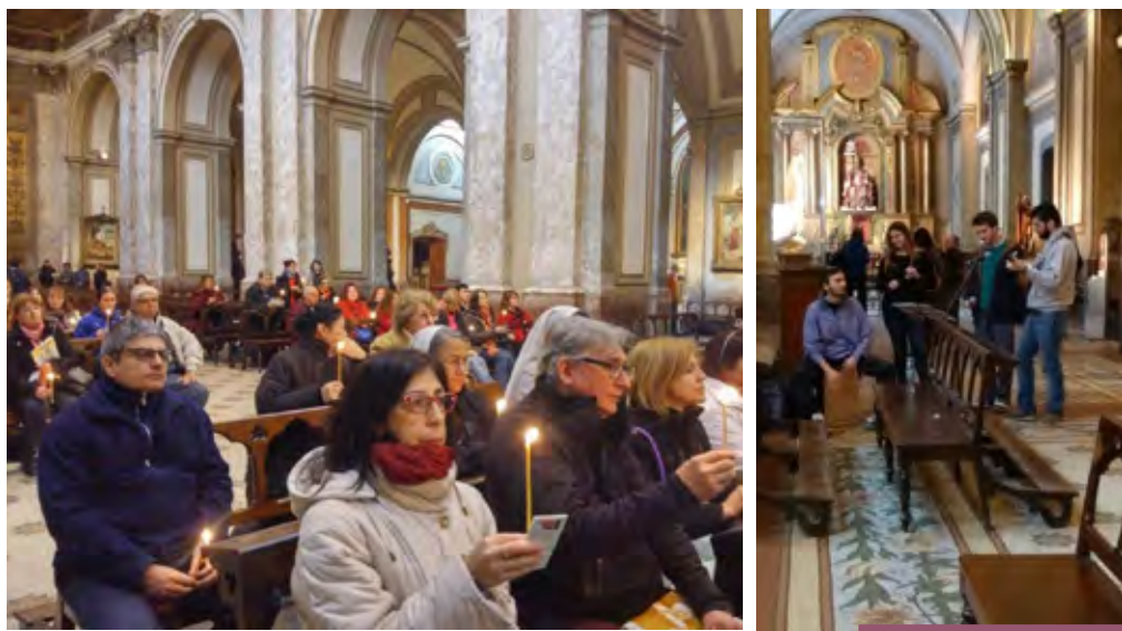
Adoración al Santísimo en la Catedral