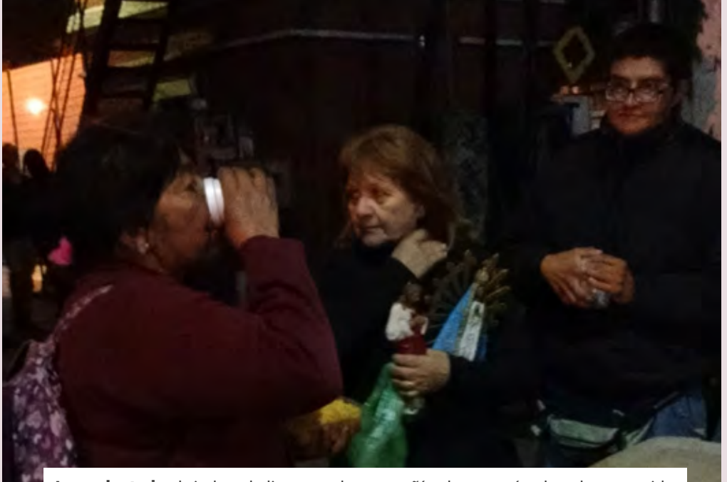
Los voluntarios brindan el alimento y la compañía al que está solo y desprotegido