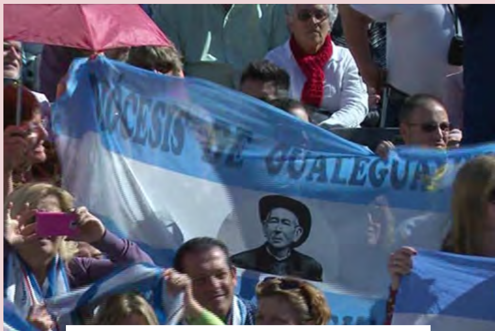
La plaza San Pedro colmada por peregrinos llegados de Argentina