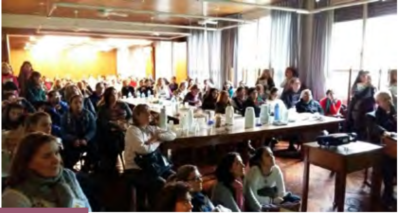
En los salones de la Curia Metropolitana el Card. Poli compartió detalles de la vida ejemplar de la nueva Beata

al llamado a vivir de modo especial la misericordia pues es un camino que parte del corazón y llega a las manos, es decir, a las obras de misericordia, invitándonos a ser misericordiosos con los demás como el Padre lo es con nosotros.