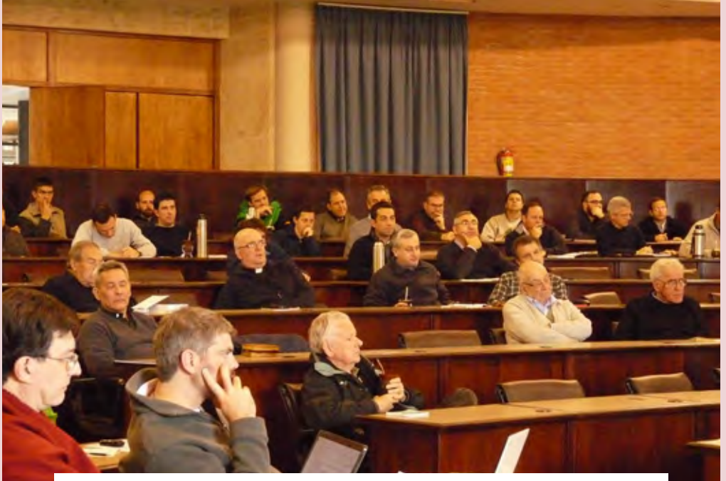
Una de las exposiciones del encuentro en el auditorio de la "montonera", Pilar