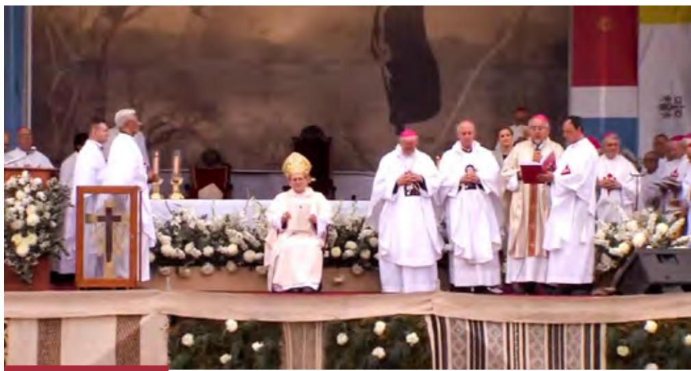
Multitudinaria celebración eucarística presidida por el Delegado Papal Cardenal Angelo Amato