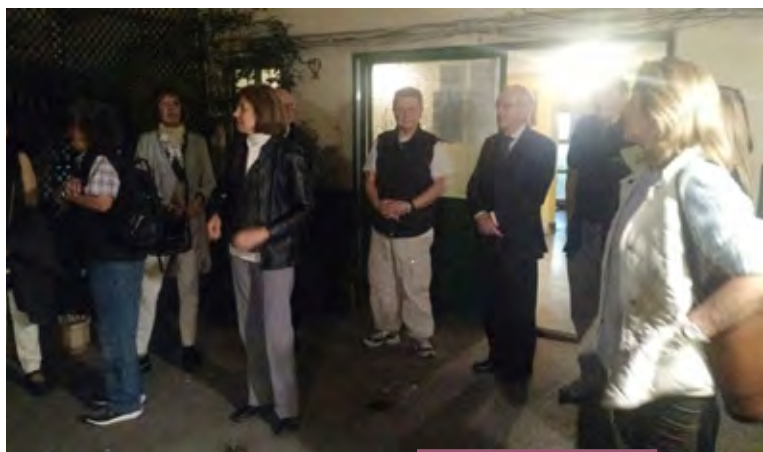
Voluntarios de San Nicolás de Bari antes de salir a recorrer las calles