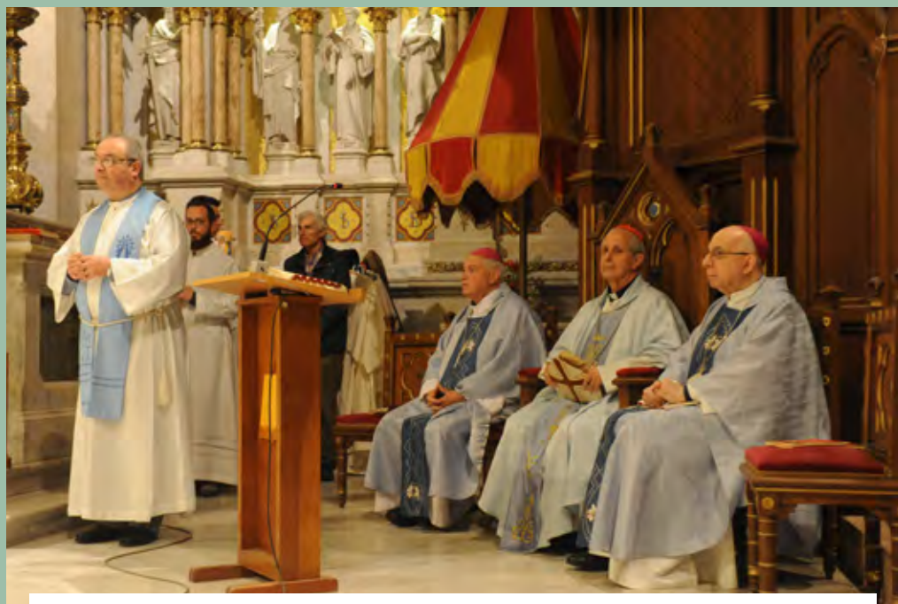
Misa central en la Basílica de Nuestra Señora de Luján presidida por el Card. Mario Poli