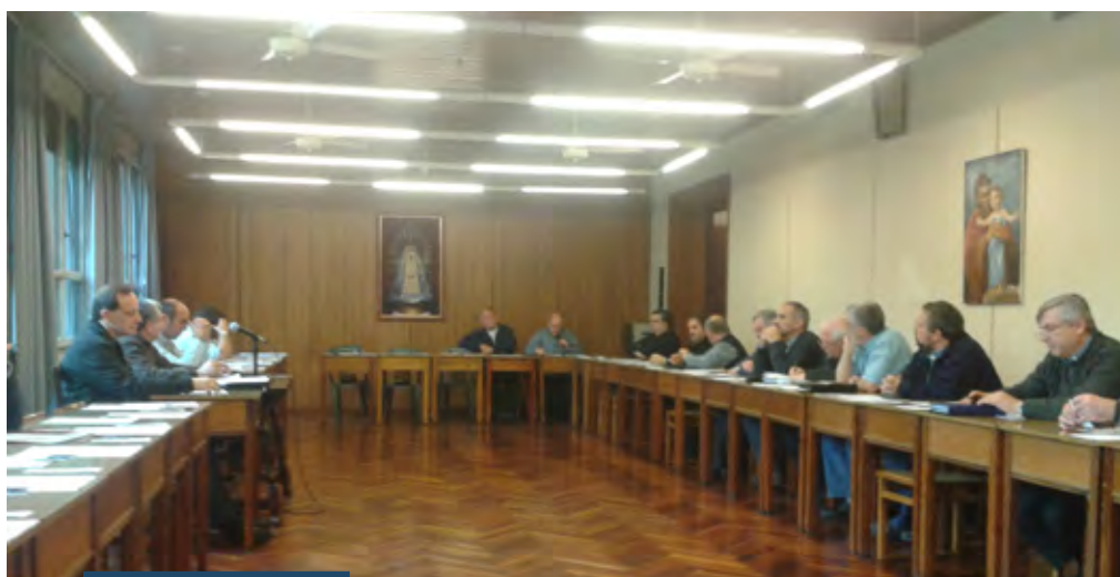
Plenario de reflexión

• En cuanto a la motivación de los sacerdotes (que somos muy importantes para motivar a su vez al laicado) en nuestra reunión quedó la inquietud: “¿Hay ganas,