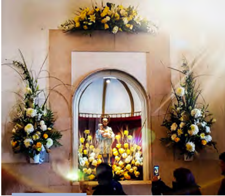
Imagen del santo patrono en el santuario San Cayetano de Liniers