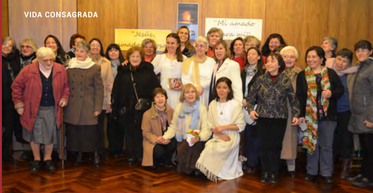
Alegría compartida después de la celebración