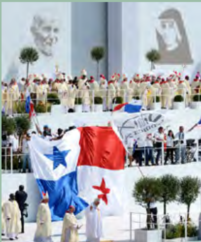
Próximo JMJ se realizará en el 2019 en Panamá