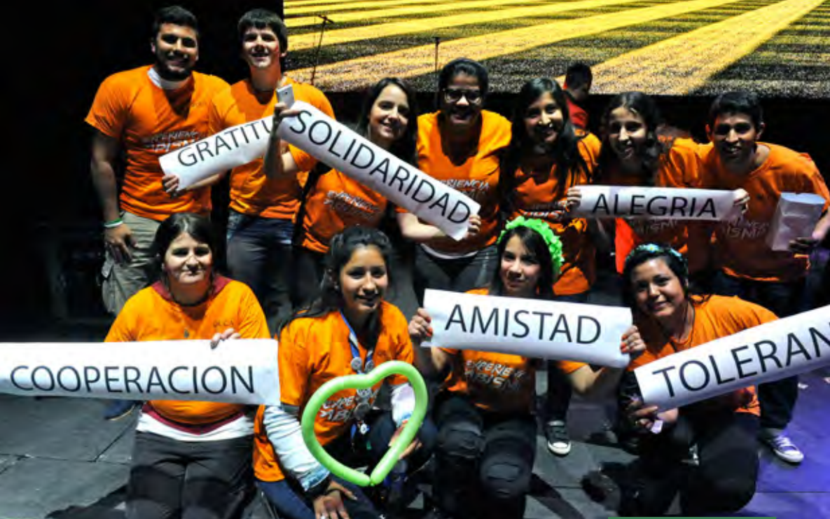
Los jóvenes expresaron las actitudes de un buen cristiano

En el encuentro estuvo presente el Arzobispo Mario Poli, quien dirigió unas alegres palabras a todos los jóvenes congregados: