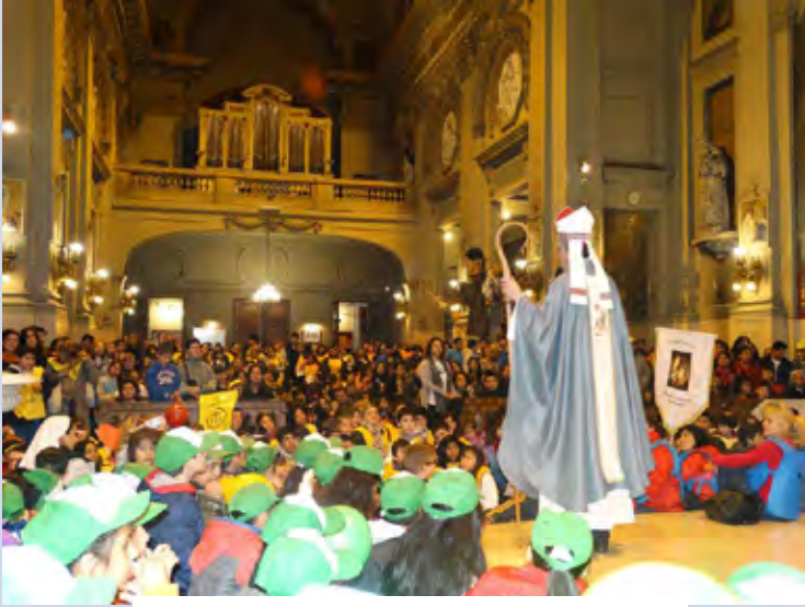
Parroquia San Nicolás de Bari Vicaría Centro