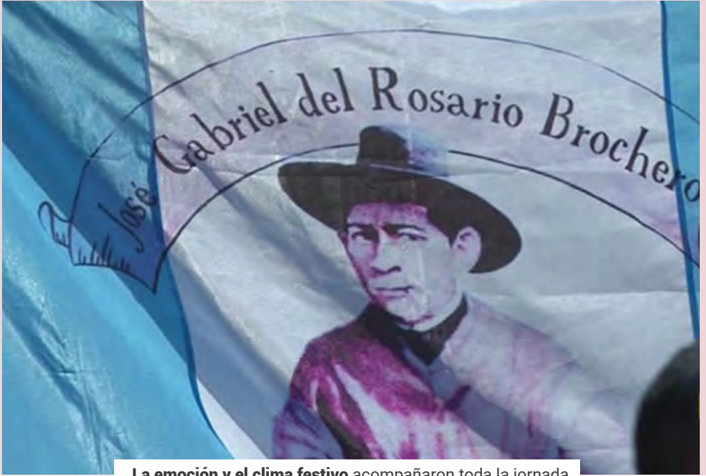
La emoción y el clima festivo acompañaron toda la jornada