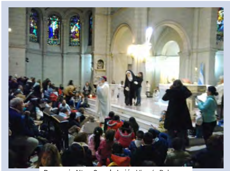
Parroquia Ntra. Sra. de Luján Vicaría Belgrano