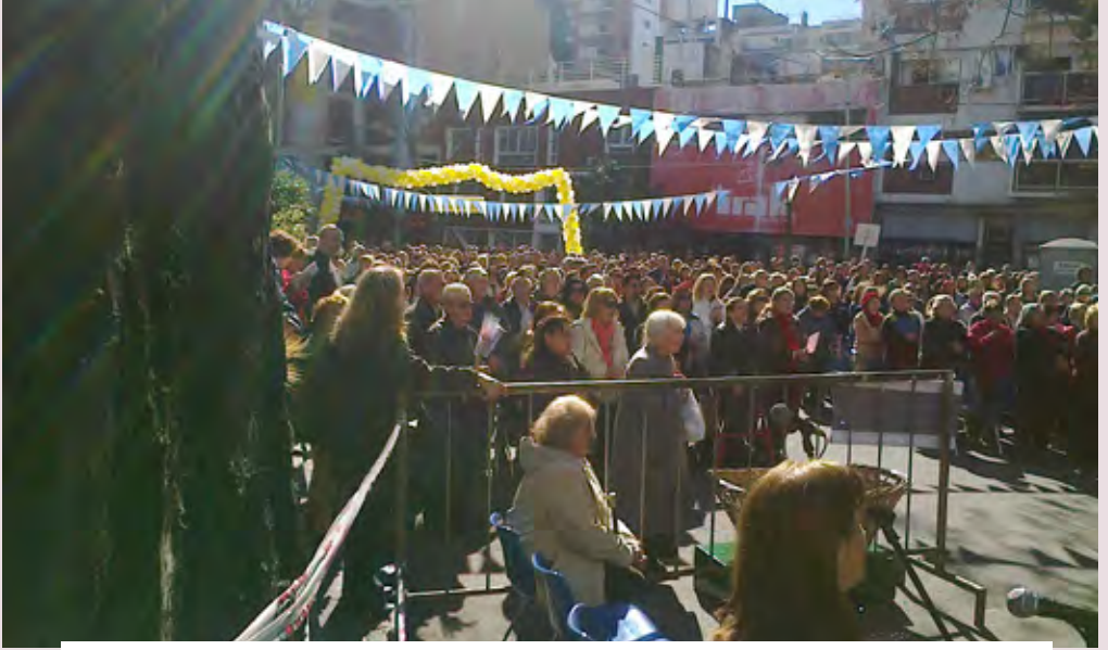
Miles de fieles participaron de la misa central. A lo lejos, la puerta de la misericordia