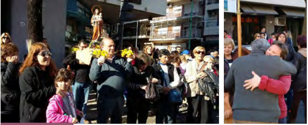
Los fieles también manifestaron su devoción a San José portando su imagen

entre cantos, oraciones, aclamaciones y campanas, celebramos la primera misa, que nos puso el corazón en un clima de fiesta y alegría que se prolongó durante todo el día.