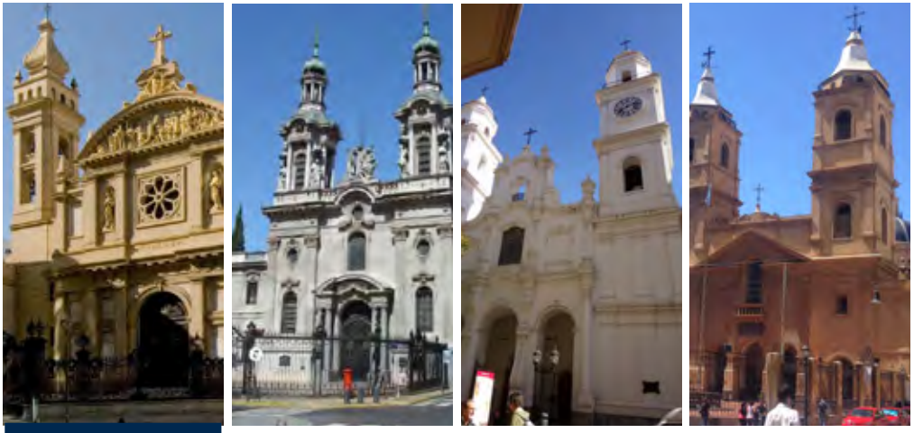
Algunos de los primeros templos contruidos en nuestra arquidiócesis por las congregaciones religiosas: Santísimo Rosario, San Francisco, San Ignacio y N.S. de la Merced.

y carismas que el Espíritu suscita en la Iglesia, se encuentra en la Argentina, a partir de la colonización del continente americano, desde el siglo XVI, con la llegada de las grandes Ordenes, como Franciscanos, Dominicos, Mercedarios, Agustinos, Jesuitas. Se afianza y expande con la llegada y surgir de nuevas y numerosas Congregaciones, sobre todo en el transcurso de 1800 y 1900, sumando una fuerza evangelizadora y de promoción humana y cristiana que incide directamente en la cultura y en la historia argentina.