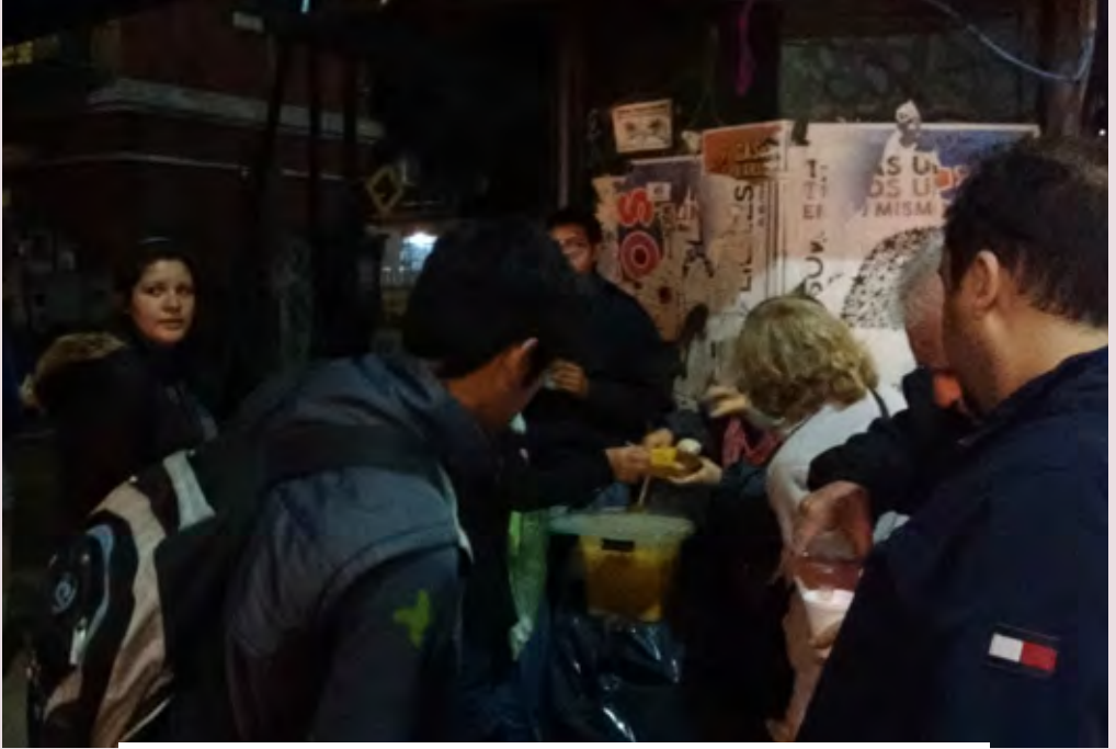
Parroquia San Bernardo en acción solidaria por las calles de Chacarita