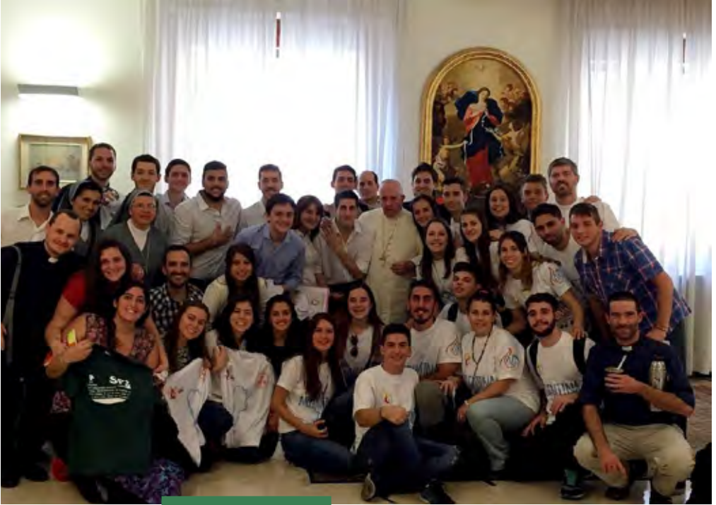
Después de la JMJ, el Santo Padre recibió a jóvenes argentinos en Roma

Y de repente llegar a un lugar donde había cientos de miles... de jóvenes, que dejaron sus comodidades, para ir al encuentro y a la búsqueda de Jesús con otros y en otros, fue caer en la cuenta de que no estamos solos en esto, y no hablo de nuestros grupos, parroquias, diócesis, provincia, país, hablo de algo mundial, somos millones y millones de personas que tuvimos el regalo de conocerlo, y hoy tenemos la obligación de darlo a conocer.