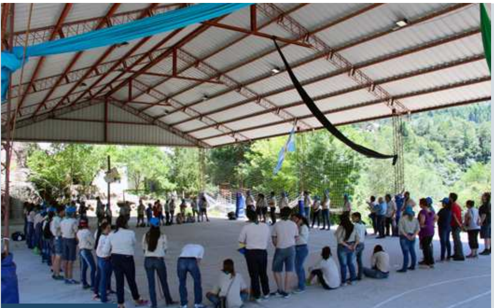
Actividades realizadas en el tinglado

Los Rovers, los más grandes del grupo, salieron al encuentro de la naturaleza. Caminaron y