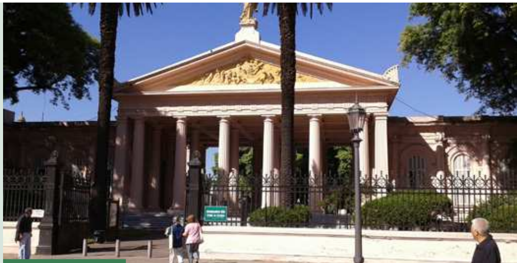
Fachada del Cementerio de Chacarita

A ésta podemos unir también la última obra de misericordia corporal que invita a enterrar a los muertos. La Biblia tiene un hermoso ejemplo al respecto: aquel del viejo Tobías, quien, arriesgando su propia vida, sepultaba a los muertos no obstante la prohibición del rey (Cfr. Tob 1,17-19; 2,2-4). Nos hace pensar en lo que sucede el Viernes Santo, cuando la Virgen María, con Juan y algunas mujeres