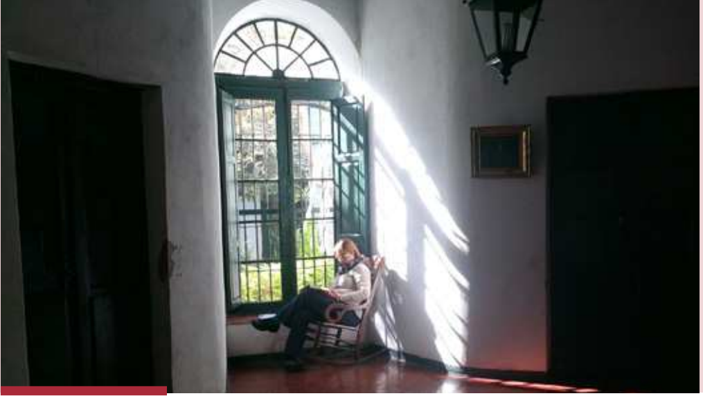
Casa de Ejercicios , un lugar privilegiado para realizar ejercicios espirituales