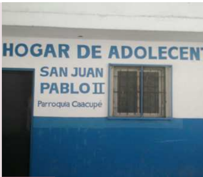
Entrada del Hogar San Juan Pablo II