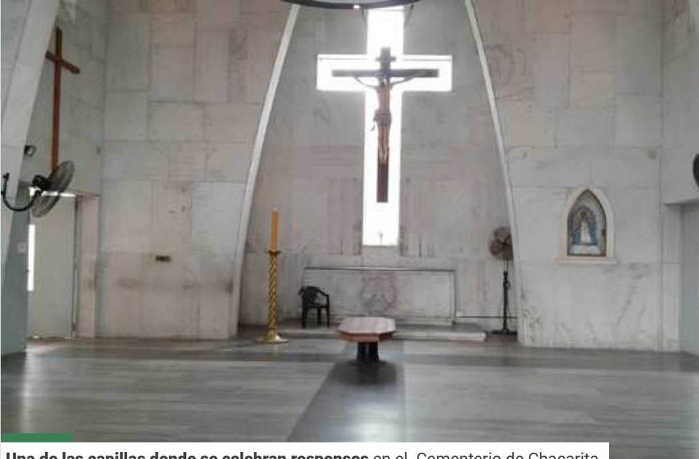
Una de las capillas donde se celebran respuestas en el Cementerio de Chacarita