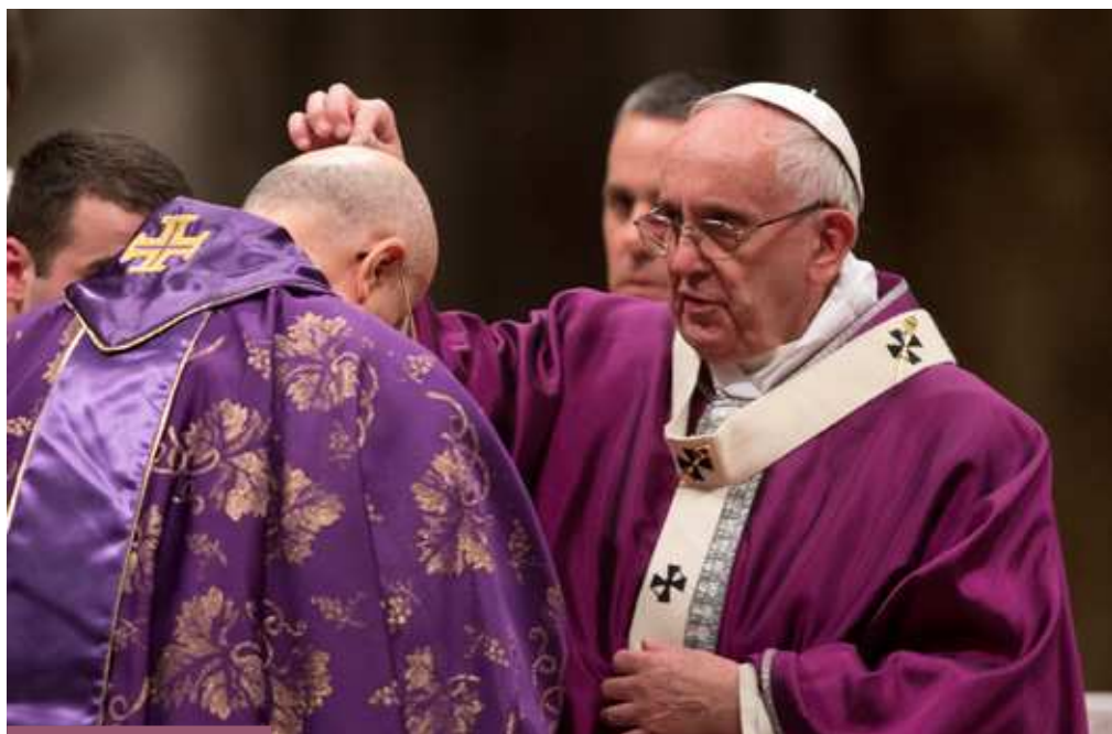
Celebración del Miércoles de Ceniza

rostro; y, como tal, es un don, un tesoro de valor incalculable, un ser querido, amado, recordado por Dios, aunque su condición concreta sea la de un desecho humano (cf. Homilía, 8 enero 2016).