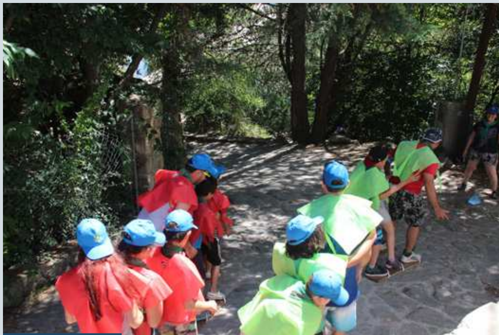
Los juegos y la diversión infaltables durante esos días