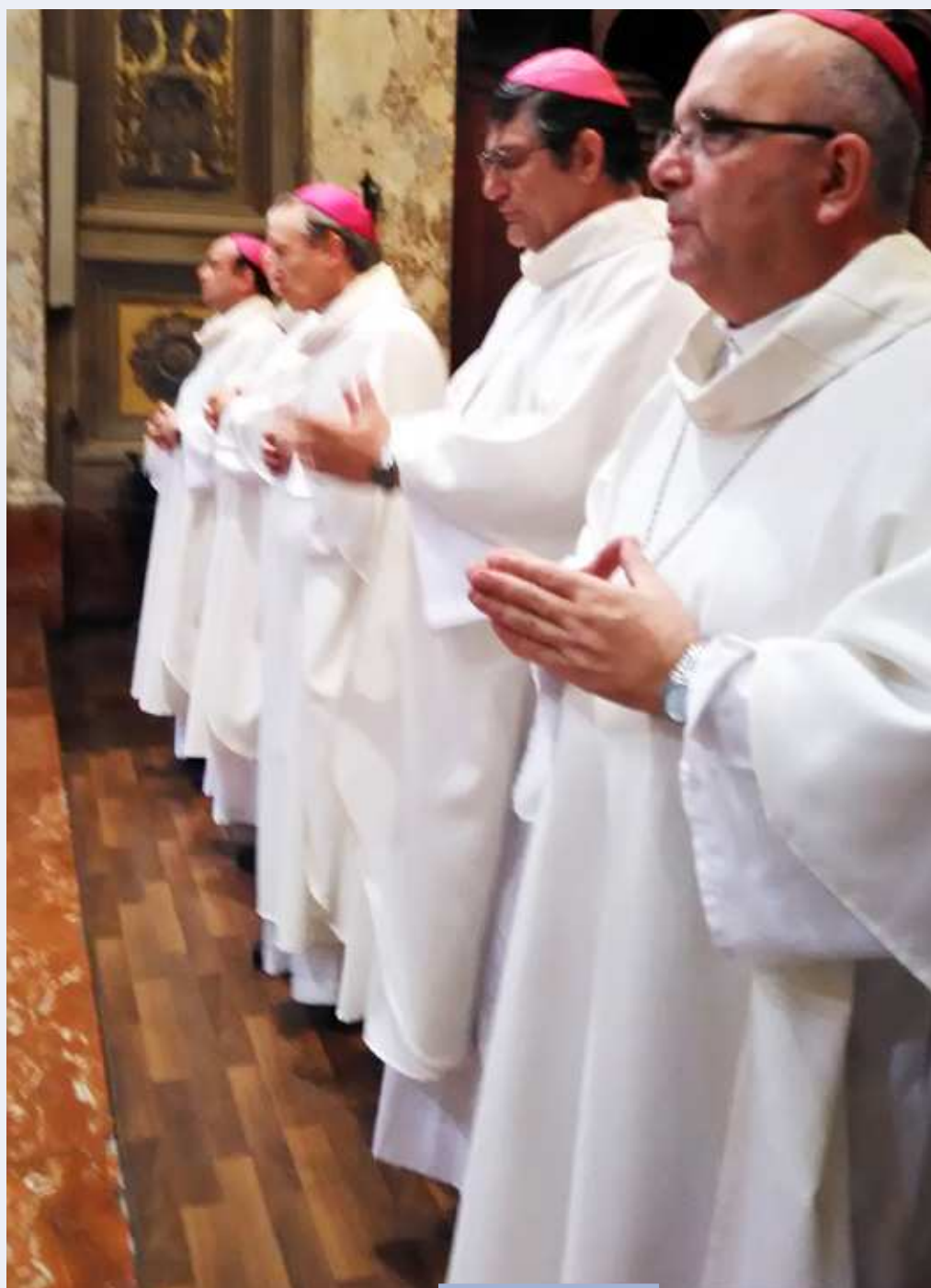
Los obispos auxiliares presentes en la celebración