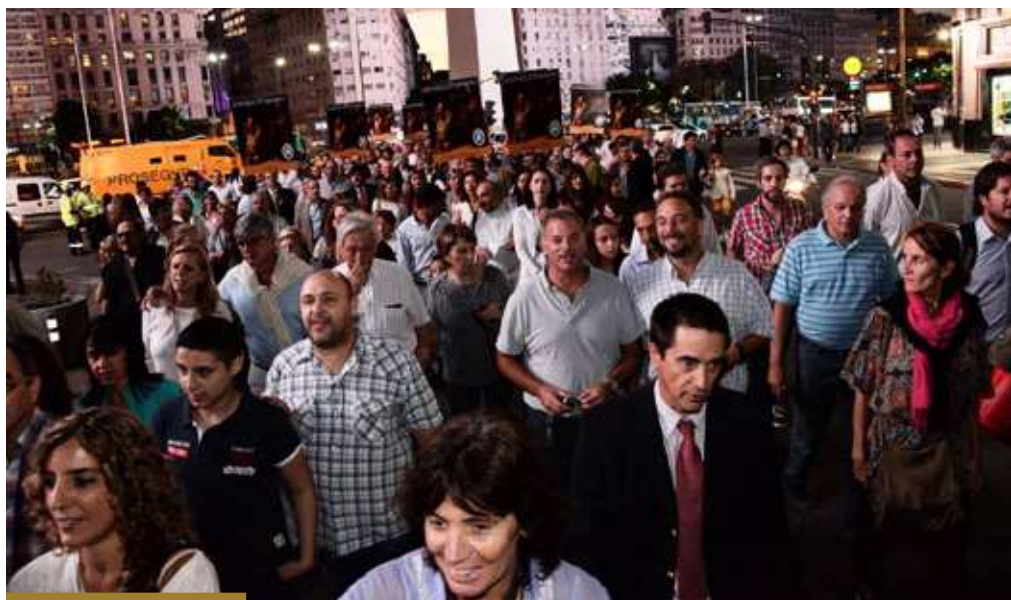
La Comunidad Entretiempo en peregrinación hacia la Puerta Santa de la Catedral (marzo 2016)

los distintos Sínodos, donde pudo verse a los obispos y al Papa del momento escuchando durante mucho tiempo. Especialmente las imágenes de San Juan Pablo II, con una paciente escucha de todas las intervenciones durante varias semanas.