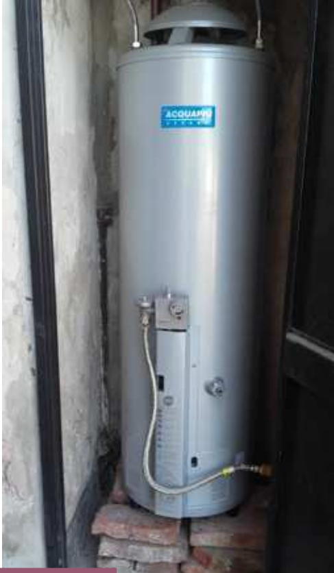
El nuevo termo tanque ubicado sobre los baños