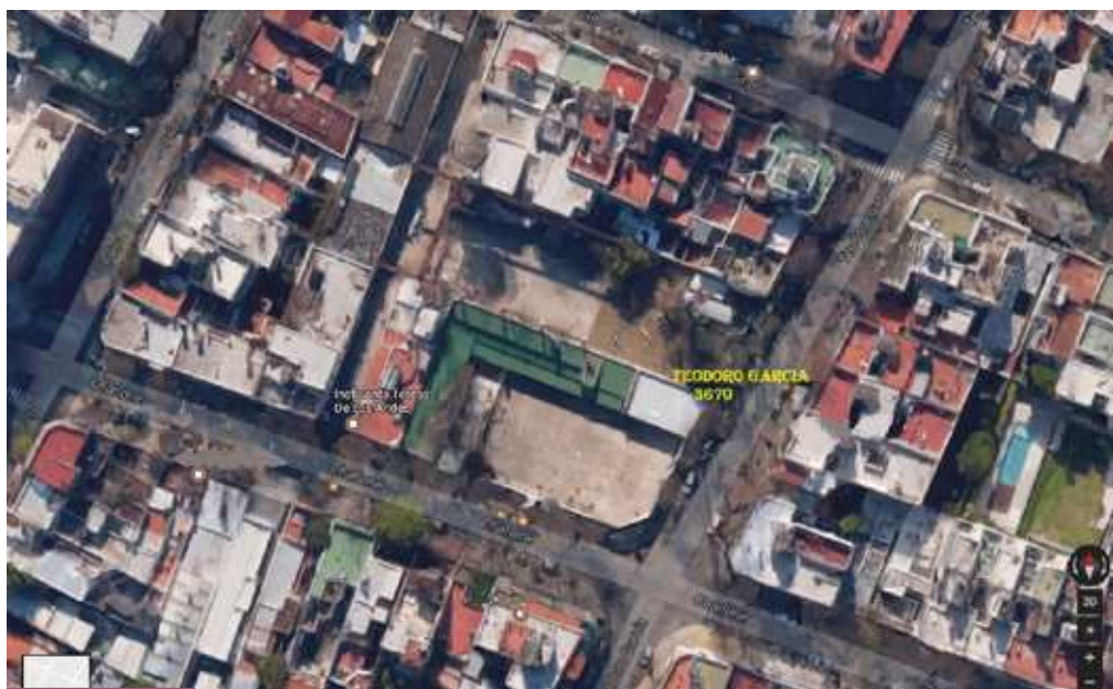
Visión aérea del terreno para el Hogar Esperanza