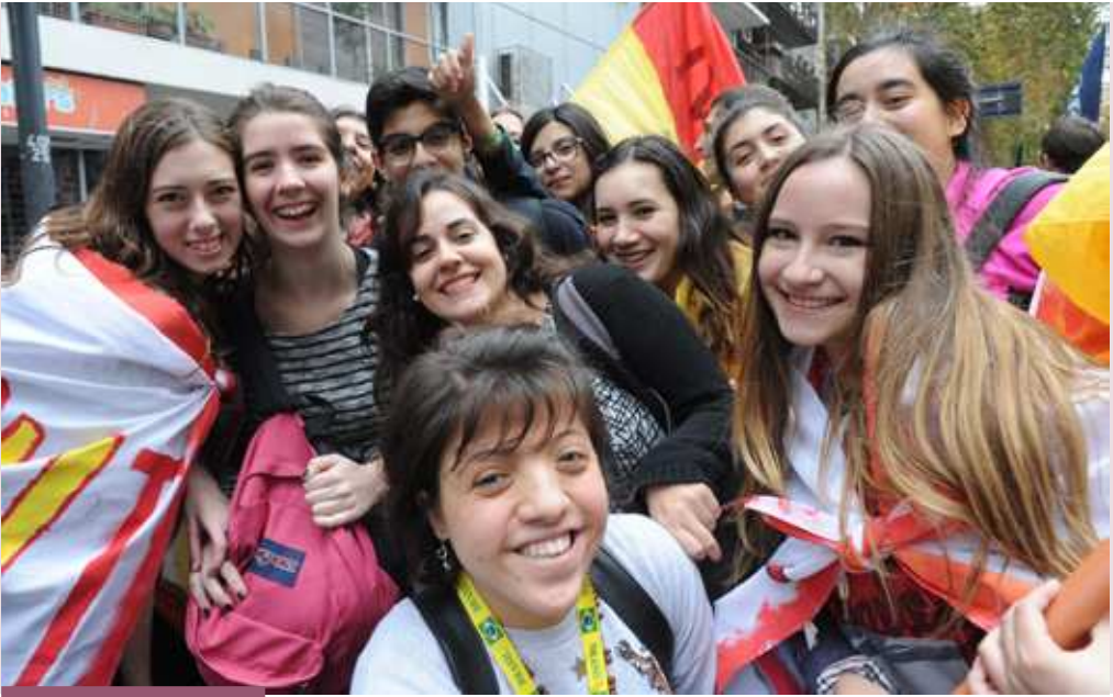
Marcha juvenil de Corpus Christi 2016

opciones audaces, no pierdan tiempo cuando la conciencia les pida arriesgar para seguir al Maestro. También la Iglesia desea ponerse a la escucha de la voz, de la sensibilidad, de la fe de cada uno; así como también de las dudas y las críticas. Hagan sentir a todos el grito de ustedes, déjenlo resonar en las comunidades y háganlo llegar a los pastores. San Benito recomendaba a los abades consultar también a los jóvenes antes de cada decisión importante, porque «muchas veces el Señor revela al más joven