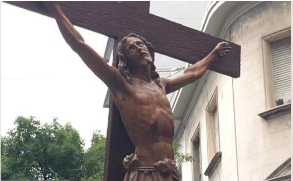
Misión de Ramos 2016 en la Vicaría Zonal Belgrano

La parábola nos muestra cómo la codicia del rico lo hace vanidoso. Su personalidad se desarrolla en la apariencia, en hacer ver a los demás lo que él se puede permitir. Pero la apariencia esconde un vacío interior. Su vida está prisionera de la exterioridad, de la dimensión más superficial y efímera de la existencia (cf. ibíd. , 62).