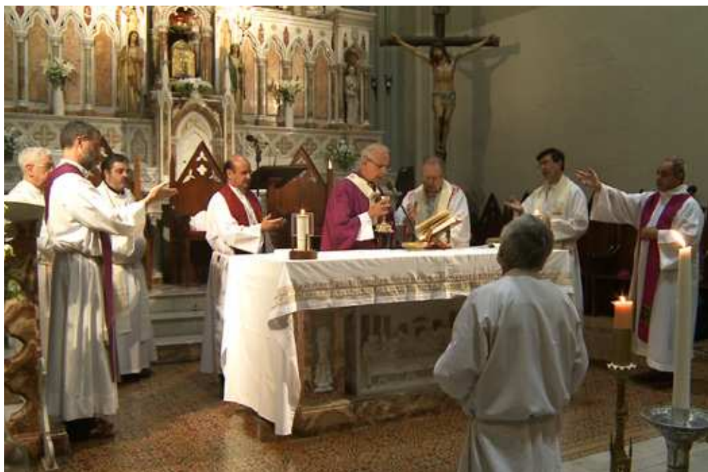
El Card. Mario Poli preside la misa exequial del jueves

asociados a la misa por televisión y a la transmisión del Ángelus del Papa en la plaza de San Pedro. Dos acontecimientos que todos los domingos, desde hace más de 20 años, llegan por TV a miles de hogares argentinos, desde donde ancianos, enfermos e imposibilitados logran unirse a la acción de gracias y a la oración que el pueblo cristiano eleva a Dios en el Día del Señor, y luego acompañan al Santo Padre en la oración mariana del Ángelus.