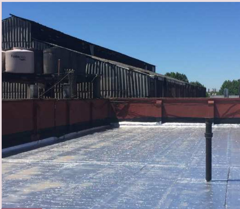
Techo de Taller Cáritas recientemente reparado