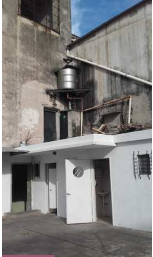
Las duchas donde las personas en situación de calle se asean cotidianamente

de las obras. En mayo de 2015 surgió la posibilidad contar con el predio ubicado en Teodoro García y Charlone. Luego de realizadas las gestiones pertinentes el 30 de diciembre de 2016 se firmó el acuerdo para su uso. Mientras tanto se encaró el