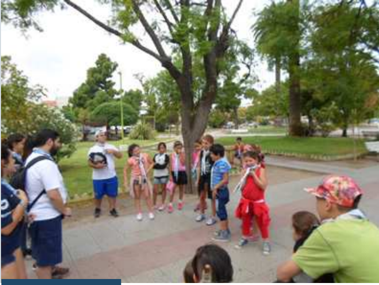
En un campamento, jamás faltan los juegos

instalaciones para actividades campamenteras. Este lugar privilegiado pertenece a la "Agrupación Scout Naval", una institución que tiene más de cien años.