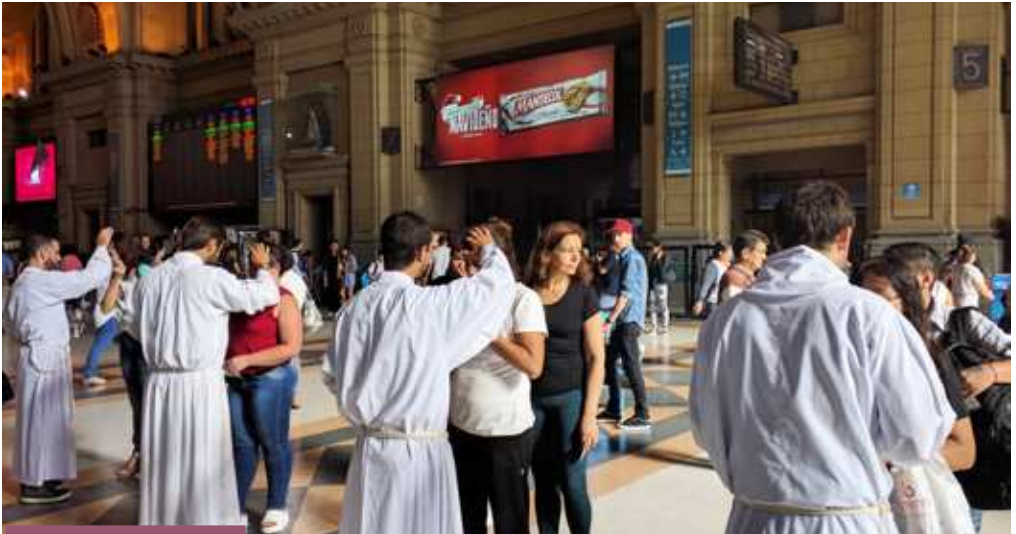
Los seminaristas en la estación terminal de Constitución