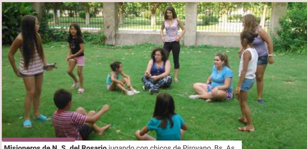
Misioneros de N. S. del Rosario jugando con chicos de Pirovano, Bs. As.