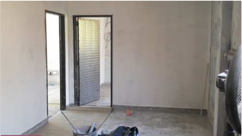
Reparación de techos y pintura en habitaciones ya existentes

se construyeron 3 habitaciones nuevas destinadas a adolescentes de la Villa 21 en situación de vulnerabilidad. Gracias a la colaboración de todos, podrán albergarse 9 adolescentes más para llegar a un total de entre 14 a 17 residentes. Además, se llevó a cabo arreglos de pintura e infraestructura tanto en la cocina como en los baños. Se cambiaron las puertas y se techaron tres de las piezas existentes.