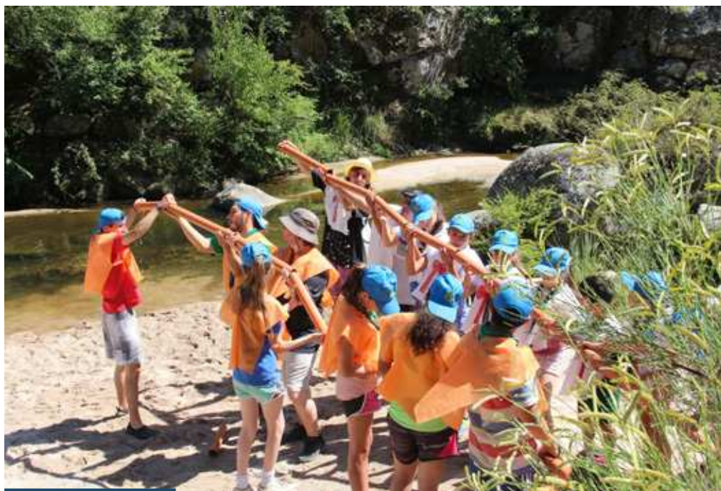
Dinámicas de integración entre los chicos