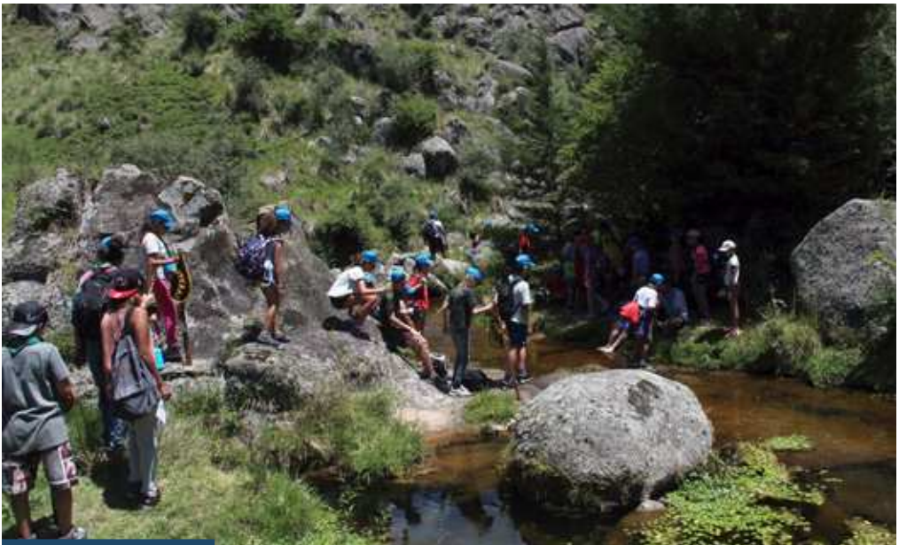
Estupor y admiración ante la belleza de la naturaleza durante las salidas y caminatas

El viaje fue excelente, y sobre todo comen-