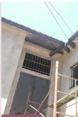
Revoque en paredes del patio interior también colocación de ventanas y rejas

Cáritas Vicaría Belgrano está acompañando la creación de un Hogar para Hombres en situación de calle, POSADA ESPERANZA. Los aportes recibidos del Gesto Cuaresmal 2015 y 2016 se reservaron para el comienzo