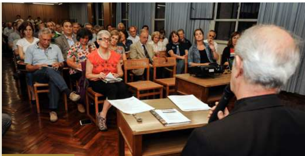
Instancia de presentación del Sínodo Arquidiocesano por parte del Card. Poli

1 Desgrabación de la presentación del Sínodo realizada por el Card. Mario A. Poli el lunes 5 de diciembre, entre las 19 y las 21 hs. en los salones de la Curia. El encuentro contó con la presencia de más de 140 laicos de unos 34 Movimientos, Instituciones y Organismos de Apostolado, además de laicos miembros de Consejos Vicariales de Pastoral.