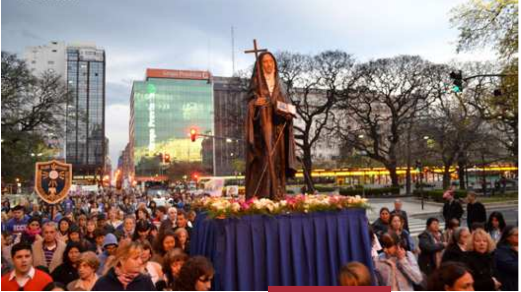
Mama Antula en el corazón de nuestra ciudad

generales para todas partes, y por nuestro mayor consuelo, deseo, que las conceda el Santo Padre.