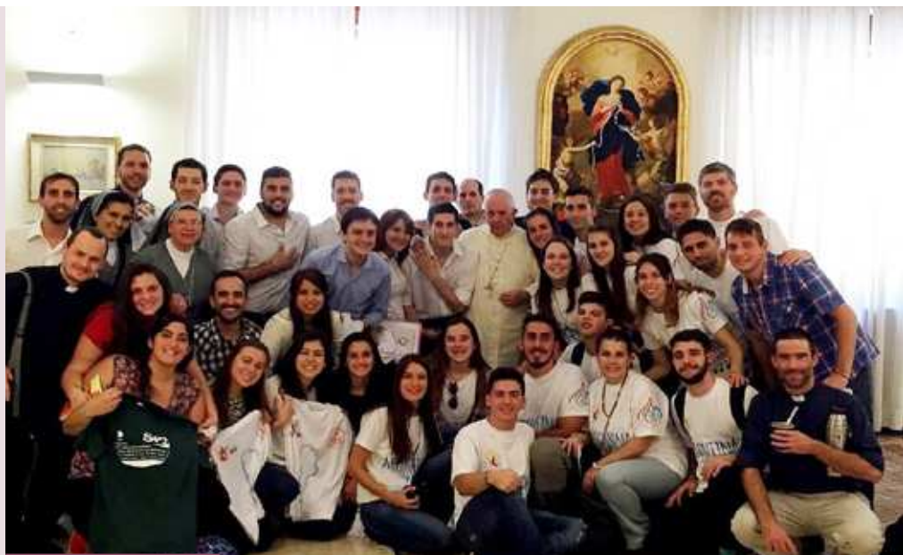
Jóvenes de nuestra Arquidiócesis visitando al Santo Padre Francisco