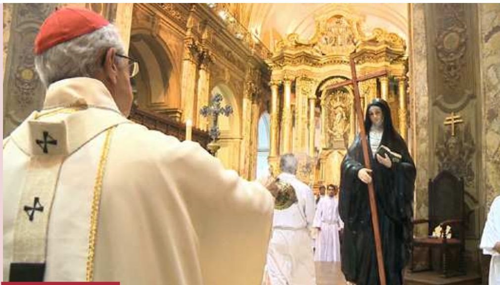
Celebración de acción de gracias por la canonización de Mama Antula. Catedral de Buenos Aires

hasta donde Dios no fuese conocido, para hacerle conocer.