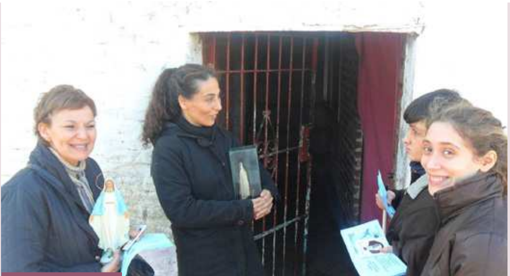
Misioneras de la Pquia. Santa María de los Ángeles de puerta en puerta llevando la Palabra

Testimonio de esto dejó el encuentro Nacional de la Juventud en Córdoba, celebrado en 1985, como producto de la renovación producida por el acontecimiento y el Documento de "Puebla", donde la participación en la sección "Misión" estuvo "copada" por más de 3.500 participantes. La prioridad por la juventud, reclamada con tanto ímpetu en Puebla, renovó profundamente el caminar de este sector de nuestra Iglesia. En 1991 se realizó el Primer Encuentro Nacional de Grupos Misioneros en Posadas, cuyo lema fue: "Más allá de las fronteras" (DP 364). La finalidad principal de este encuentro consistió en "Fortalecer nuestra conciencia de Iglesia para impulsar, desde