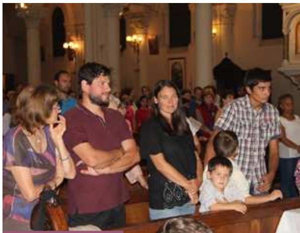
Iglesias Hermanas: Familia Serra en acción de gracias