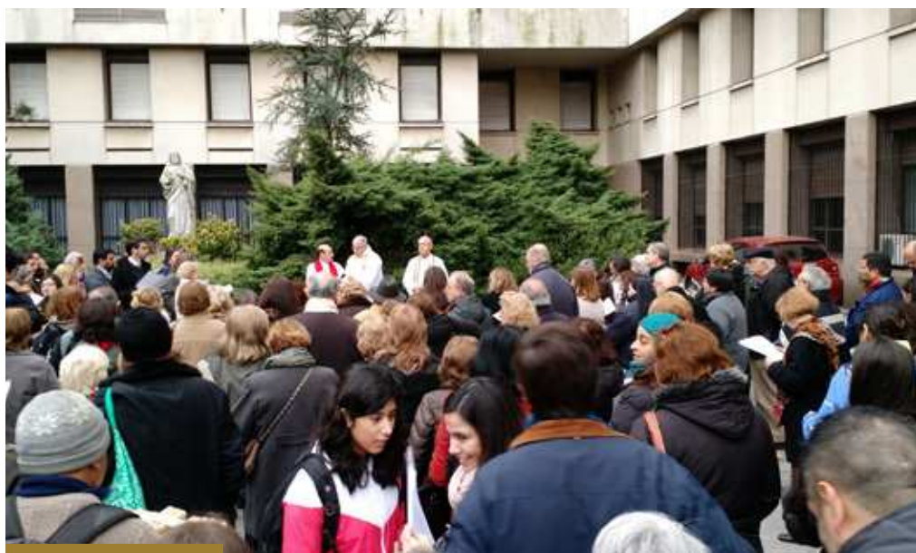
El DEMEC reunido en el playón de la curia para la celebración de la Eucaristía (mayo 2016)