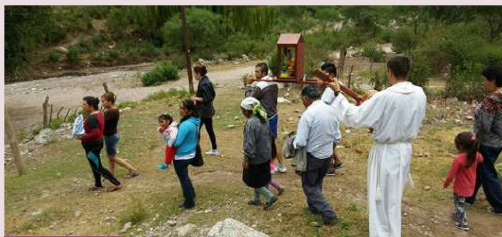
Procesión de los misioneros de N. S. del Carmen (F) junto a nuestros hermanos catamarqueños