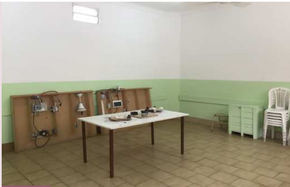
El taller Electricidad donde se dictan clases