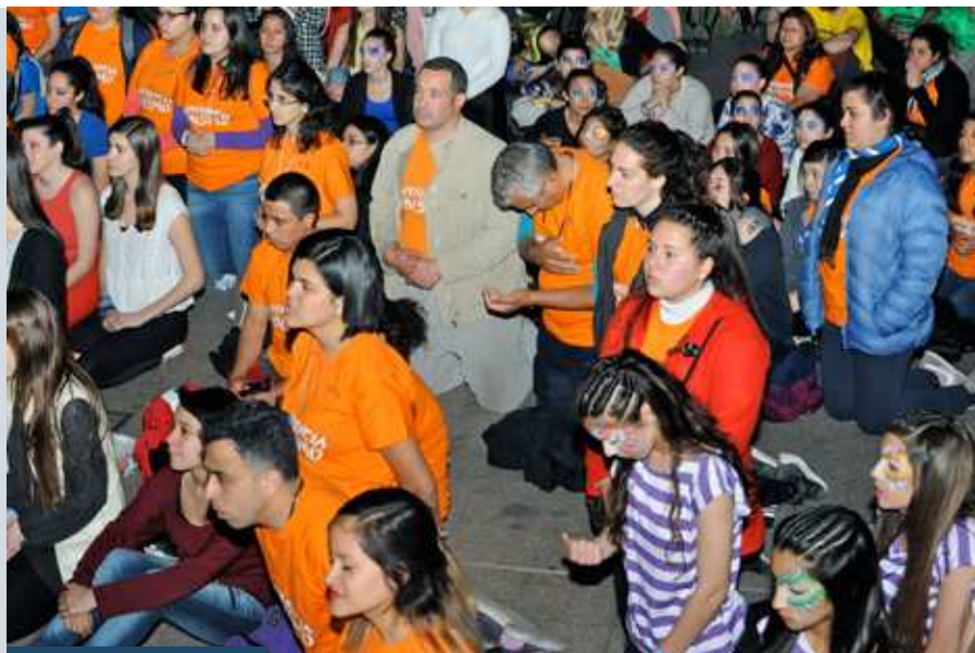
Experiencia Abismo, Luna Park, septiembre 2016

a la vida. Los jóvenes necesitan vida, esto es, caminar, avanzar, trepar los caminos y soñar nuevos horizontes.