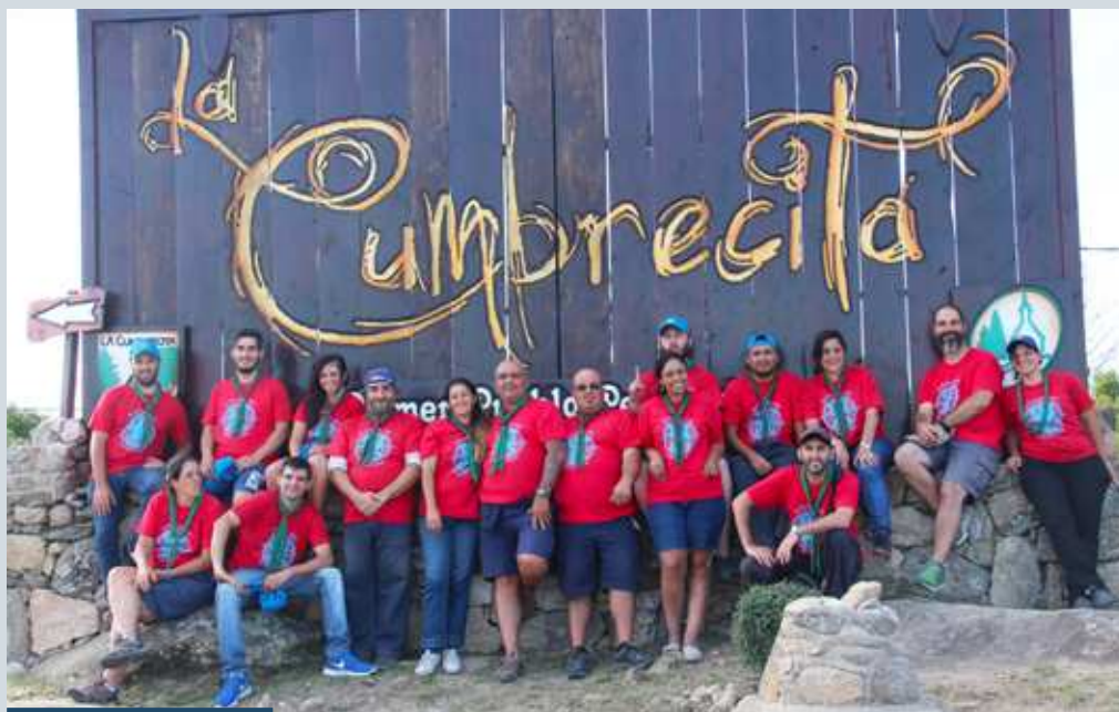
Dirigentes del campamento