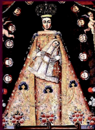
Imagen: "Nuestra Señora de Belén"